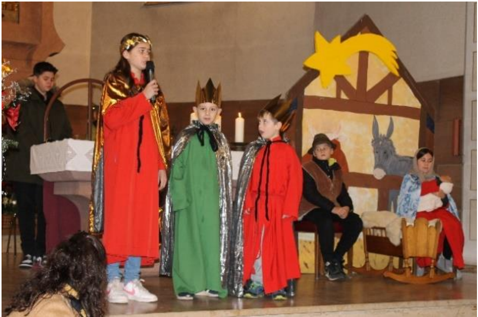
Besuch der Heiligen Drei Könige im Stall bei Maria und Josef